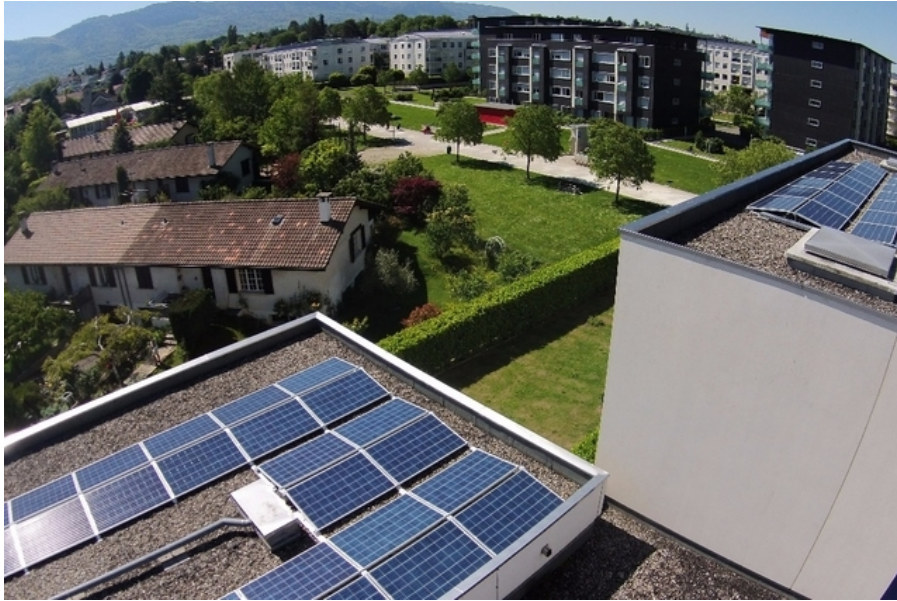
Unkomplizierte Stromerzeugung: Solarpanels von Younergy.

Ein Westschweizer Start-up finanziert Hausbesitzern die Solaranlage nicht nur, es räumt ihnen auch viele Hindernisse aus dem Weg.